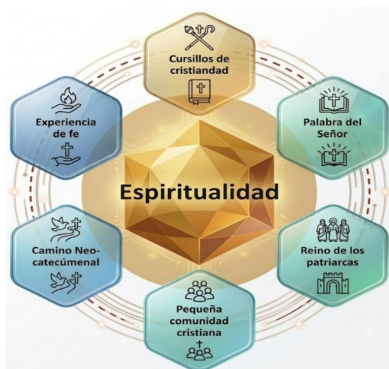
Núcleo temático emergente: Espiritualidad